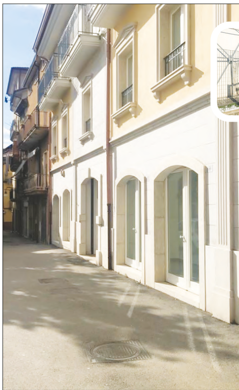
La sede della Misericordia in via Rapolla ha ricevuto l'ok dell'organo tecnico dell'Asl per effettuare le vaccinazioni anti-Covid per gli ultraottantenni. L'alternativa, invece, era stata individuata nella tendostruttura ad Albanite

Ad Atripalda sono oltre 700 gli ultra80enni, la