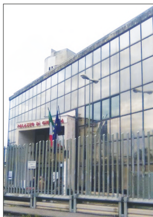
La Corte di appello di Napoli ha confermato la sentenza