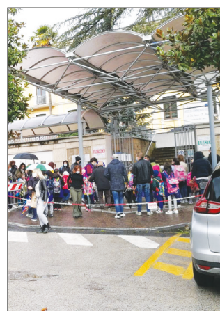
In questi giorni sono risultati positivi altri studenti

Il sindaco ancora indeciso se riaprire da lunedì oppure proseguire con la dad