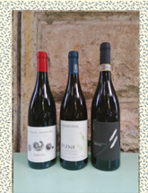
ROSSI DA AMARE Box 3 Bottiglie