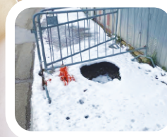
Le palazzine negli ultimi anni hanno mostrato più di un segnale di cedimento; anche le strade del quartiere, purtroppo, mostrano preoccupanti segnali di usura