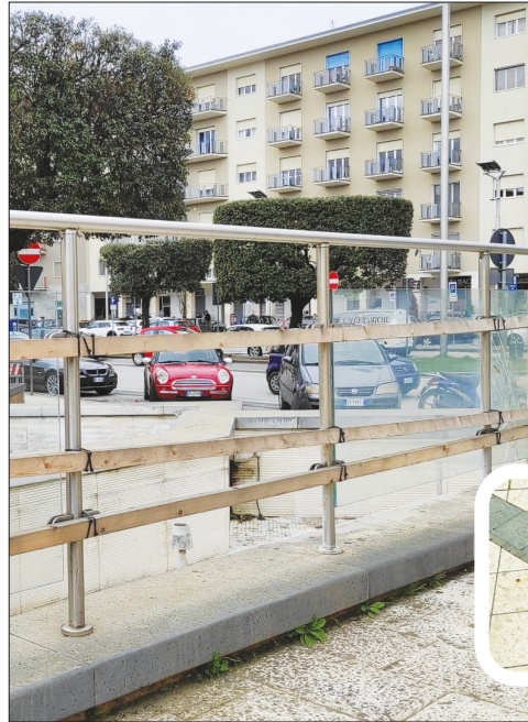
Il parapetto della fontana è “provvisorio” da tanto tempo; nel riquadro una piastrella danneggiata

Al di là delle festività o delle manifestazioni, dovremmo forse interrogarci tutti - amministratori, urbanisti, tecnici, cittadini - sulla quotidianità di questo luogo e sulla sua fruibilità. Dal 2007 “fòre 'o mercato” si è dotata di una nuova veste, dopo una lunga fase progettuale. Una piazza - alcuni lo chiamerebbero più