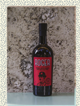
BITTER ROGER Vecchio Magazzino Dogonale