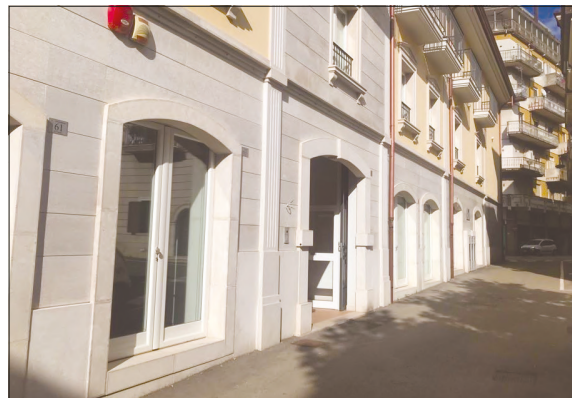
Oltre 700 gli anziani che hanno diritto al siero antivirale

A pensar male si fa peccato, ma spesso ci si azzecca: la sede della Misericordia da tempo è stata indicata come punto di vaccinazione, incassando anche l'ok dell'organo tecnico dell'Asl, ma al momento non ha aver avuto ancora il via libera definitivo mentre in altri comuni si viaggia al ritmo di almeno 700 vaccinazioni al giorno.