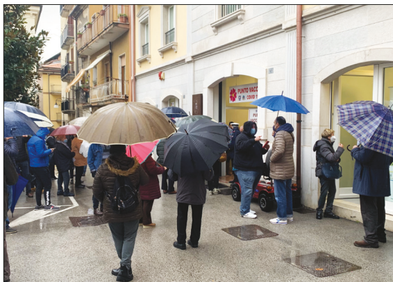
Rissa con sputi davanti al Punto vaccinale di via Rapolla