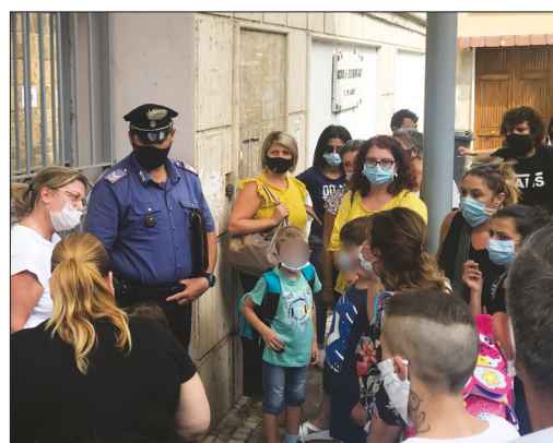
L'associazione 'Mamme 23 settembre' è nata dopo che, nel settembre 2020, si registrò una forte protesta dei genitori (nella foto) per la carenza di adeguate misure antiCovid

Dopo un solo giorno di didattica a distanza, martedì scorso gli alunni dell'Istituto comprensivo di Atripalda sono tornati in classe dopo l'annullamento, in sede cautelare, dell'ordinanza governatore De Luca. Tuttavia, né il servizio mensa e né il servizio trasporto erano attivi, il che sommato al poco preavviso e al disorientamento generale, ha fatto sì che le classi siano rimaste quasi del tutto vuote, col risultato che gli alunni hanno sostanzialmente perso un giorno di lezione. Da mercoledì in poi, invece, l'affluenza a scuola si è normalizzata, eccezion fatta per le assenze dovute ai casi di Covid che si stanno contando anche fra gli alunni atripaldesi. La preoccupazione è tanta ed a farsene carico è stata l'associazione 'Mamme 23 settembre' che in una nota ha posto una serie di interrogativi all'Amministrazione comunale di Atripalda: "Nostro malgrado - si legge nel comunicato -, a distanza di più di un anno dal settembre 2020, come gruppo 'Mamme 23 settembre' torna-