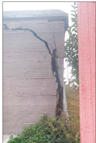
Non sappiamo se l'intervento di riqualificazione della villa comunale e delle strutture annesse, appaltato

Inoltre, osservando con più attenzione anche altre parti della struttura realizzata a metà degli anni '90, si nota agevolmente che sono numerosi i punti che, soprattutto a causa delle infiltrazioni d'acqua, manifestano preoccupanti criticità come lesioni o cedimenti.