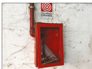
ormai più di tre mesi fa ma non ancora cominciato, per un importo di circa 43mila euro, preveda anche la messa in

sicurezza di "Piazza del sole", ma nel parcheggio interrato non sembrano essere rispettate neanche le più elementari norme di sicurezza e, quasi certamente, a rigor di norma, la sosta veicolare (che per'altro è a pagamento) andrebbe interdetta.